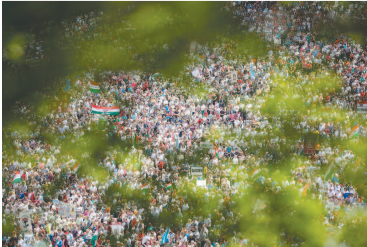
Fotó: MTI (illusztráció)

Aggodalmaskodva indultam el pénteken Segesvárról, mivel az előrejelzések szerint nem sok jóval ke-