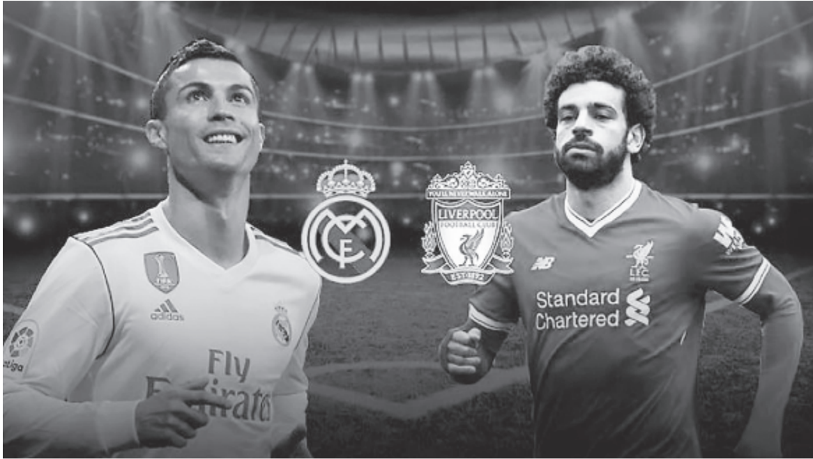
Sok múlhat a két csapat vezéregyéniségén, Cristiano Ronaldo (b) és Mohamed Szalah pillanatnyi formáján

Könnyen Madrid lehet idén az európai futball fővárosa – ehhez csak annyi kellene, hogy az Atlético Európa-ligás (EL) győzelme után a Real Madrid megnyerje a Bajnokok Ligája (BL) döntőjét, amelyet május 26-án, szombaton Kijevben rendeznek (TV: M4 Sport, Pro TV).